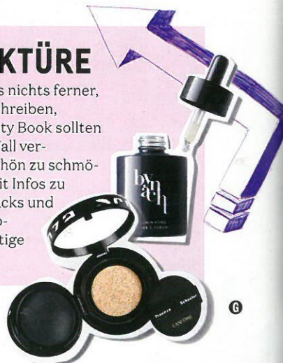
Redaktion: Brigitte Haase; Fotos: Thomas Whiteside for Givenchy Parfums; Hördur Ingason; Ben Morris; John-Paul Pietrus; Skille-Lifes; Studio Conqué-Nast; Illustration: Patrick Mason

Normalerweise liegt uns nichts ferner, als Ihnen etwas vorzuschreiben, aber: Unser neues Beauty Book sollten Sie wirklich auf keinen Fall verpassen. Es ist wunderschön zu schmökern und vollgepackt mit Infos zu Inhaltsstoffen, Profi-Hacks und inspirierenden Make-up-Strecken. Mehr zeitgeistige Beauty geht nicht.